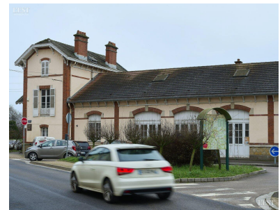
Le chantier de la piste cyclable entre la gare de Neuves-Maisons et le CHU de Brabois devrait être terminé avant l'été.

Le maire a terminé son discours en remerciant le foyer rural et le comité des fêtes en invitant les habitants « à venir renforcer les équipes de bénévoles ». ■