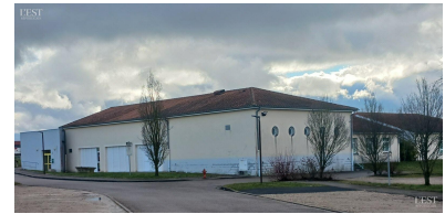
2025 portera sur la baisse des consommations d'énergie.

double flux sont les principaux travaux. La mise en œuvre de panneaux photovoltaïques permettra de fournir 100 kW crête. Deux bornes de recharge de véhicule électrique seront installées au centre de la commune. ■