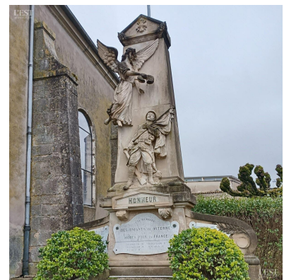
Une cagnotte pour restaurer le monument aux morts et des fontaines, patrimoine du village ?

Faire une demande de subventions auprès de la fondation du patrimoine pour la réfection du monument aux morts et de deux fontaines, il faudra lancer une cagnotte auprès des habitants, un groupe de travail pourrait se faire pour avancer ce dossier. ■