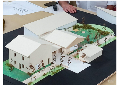
Le projet en maquette.