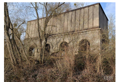
Façade orientée vers Sexey-aux-Forges. Les bennes aériennes déversaient à leur arrivée le minerai dans le haut du Zinzin.

montaient au sommet des pylônes hauts d'environ 20 m, grâce à l'échelle intérieure, afin d'avoir une vue exclusive. Il se souvient aussi avoir été embauché, à 18 ans, avec les mêmes amis, pour démanteler l'embranchement de la voie ferrée qui permettait l'accès des wagonnets au Zinzin. Un ferrailleur avait acheté l'accumulateur ainsi que la locomotive abandonnée dessous et les pylônes. Les jeunes hommes devaient porter des travées de rails de 6 m de long. Pas besoin alors de salle de sport pour parfaire sa musculature ! ■