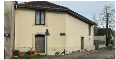
Deux logements dans la maison Bietrix.

mettre à l'honneur Claude Kiffer pour son engagement en tant que bénévole pour les diverses manifestations organisées par la commune. ■