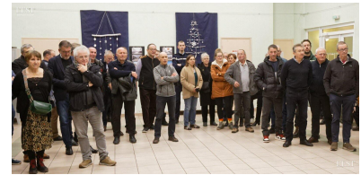
Les habitants sont venus nombreux à la cérémonie des vœux.