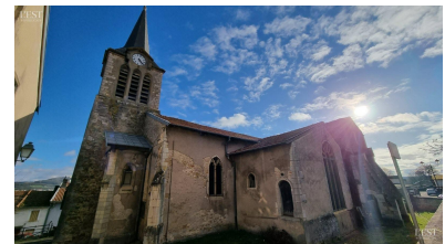
Parmi les projets de l'année 2025, la maire a évoqué la restauration de l'église Saint-Julien-de-Brioude.